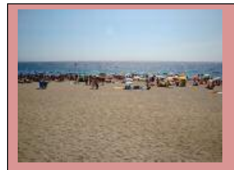
15 agosto 2015 – ore 9.00